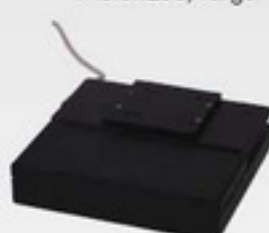
INV3 & INV4