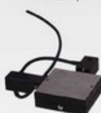
INV3 & INV4